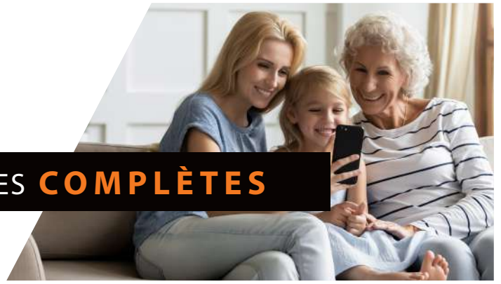
Tableau de garanties