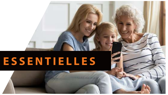
Tableau de garanties